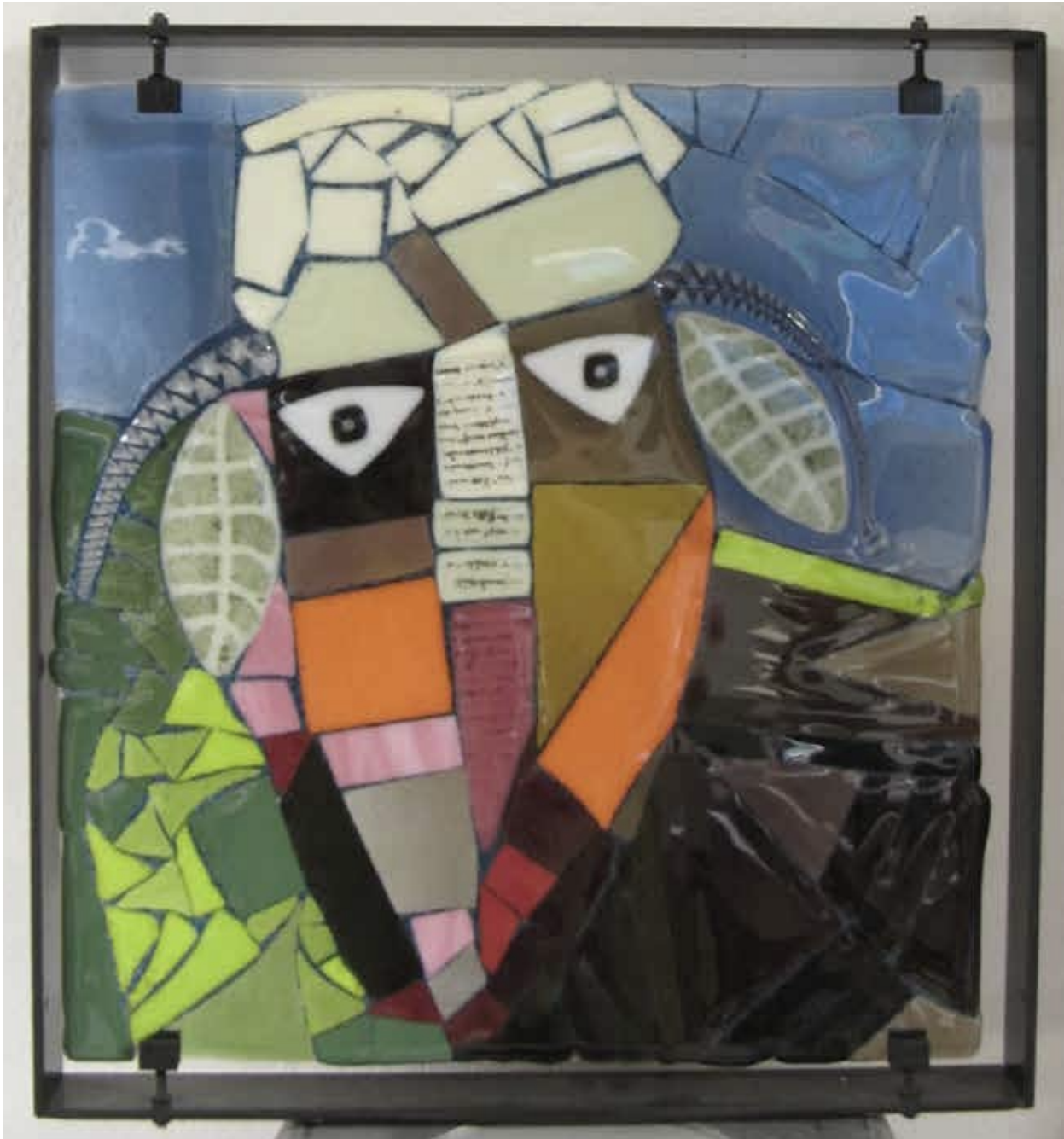
Vibeke Skov: Maske i glas.